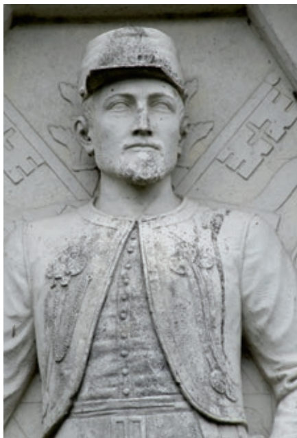
Zoeavenbroe- derschap Fidei et Virtute met vaandel, circa 1900.