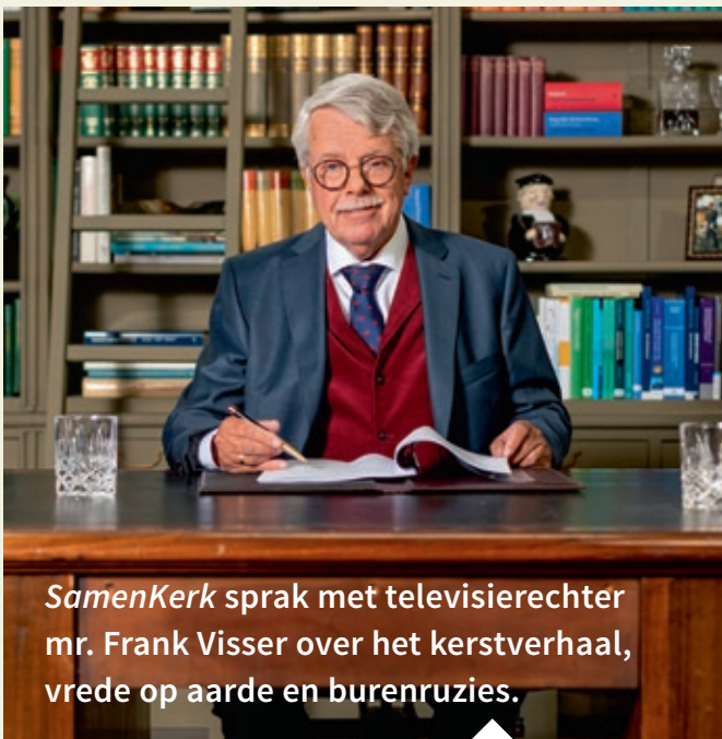
SamenKerk sprak met televisierechter mr. Frank Visser over het kerstverhaal, vrede op aarde en burenruzies.