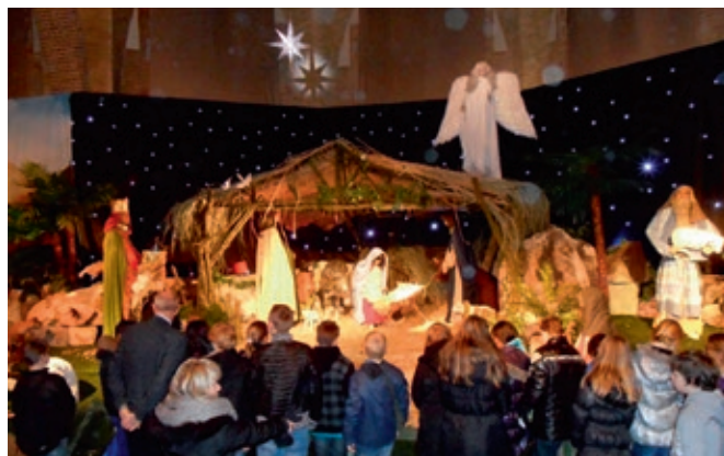
← De grote kerststal in de H. Agathakerk in Beverwijk

Zaterdag 19 december om 19.00 uur start de virtuele kerstwandeling door Weesp: een zoektocht naar het Kerstkind. Neem samen met de herders en de wijzen uit het oosten deel via www.kerstwandelingweesp.nl .