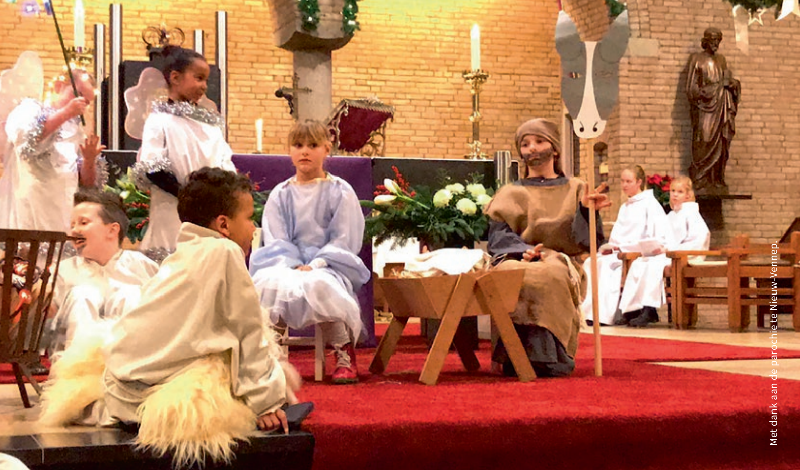
Met dank aan de parochie te Nieuw-Vennep