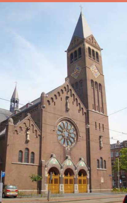
Gerestaureerde westgevel (met klok in vieringtorentje!)

De bedoeling van deze serie artikelen is om aandacht te besteden aan de verbeelding van de Bijbel (met name van het Oude Testament) in de kerkelijke architectuur. We behandelen al menige kerk in binnen- en buitenland. Ook in ons eigen bisdom zijn interessante kerken: de uwe? We worden goed op de hoogte gehouden van bouwprojecten zoals in Amsterdam. Daar is de Franciscus van Assisi (Boomkerk) aan de Admiraal de Ruijterweg op 6 september weer heropend na een uitgebreide restauratie.