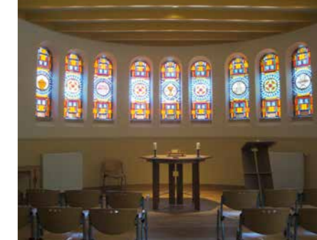
Dagkapel met ramen uit de Chassékerk