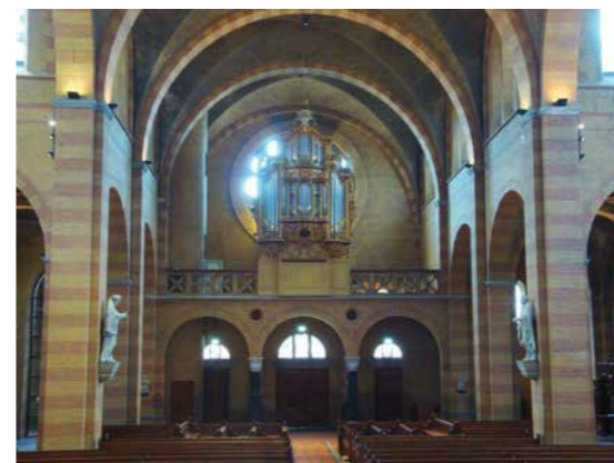
Gerestaureerd schip met Hilgersorgel

bleven gespaard. De nieuwe tijd bracht niet alleen maar afbraak. Zeer boeiend zijn de kleurige ramen in de zijwanden boven van het Zonnelied van Franciscus. Ze dateren uit 1965 en zijn van de hand van L. Smeets en uitgevoerd door de firma Geutjes. Nog meer fraais kwam er zeer onlangs. Zonnige ramen die de Marialitanie van Loreto verbeelden, afkomstig uit de voormalige Chassékerk, sieren sinds vorig jaar de ronde dagkapel aan de noordoostkant. Uit diezelfde kerk werd ook een klok overgebracht naar hier. Die werd in de dakruiter (de sierlijke kleine middentoren op de viering) opgehangen.