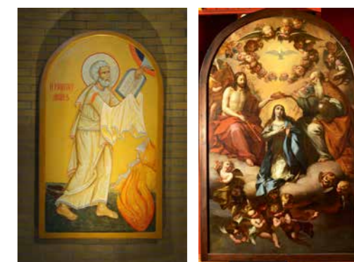
Mozes ontvangt de Wet (ingewijd 6 sept.2015)