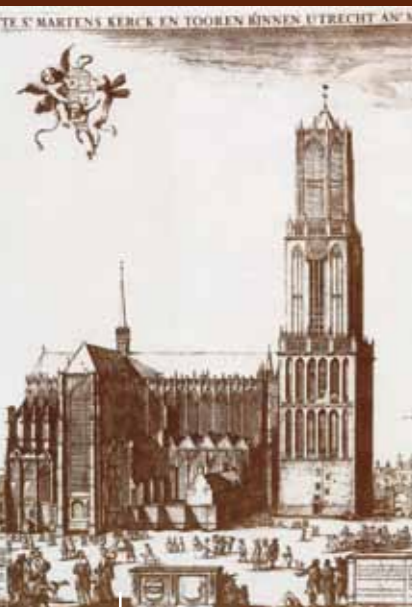
De oude domkerk in zijn volledige staat (gravure uit 1660).