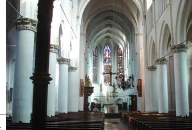
Het gerestaureerde interieur.

uiteindelijk in 1900 gerealiseerd onder leiding van architect Tepe. Hij verlengt het schip met één travee en voegt aan de noordkant een toren en een doopkapel toe. De westgevel kopieert hij van de oude, maar de top van de toren lijkt verdacht veel op die van het stadhuis van Kampen. Daarna komen nieuwe klokken, een nieuw orgel, fraai tegelwerk en beglazing.