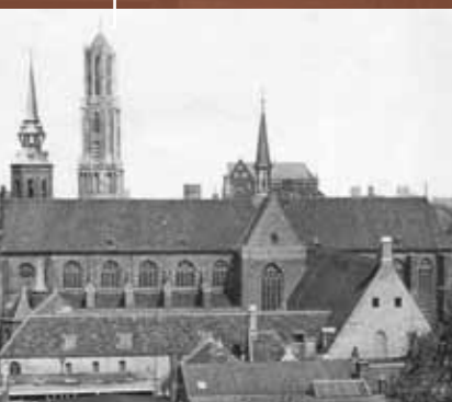
St. Catharijnekerk met de Domkerk op de achtergrond.

Utrecht is vanouds het centrum van katholiek Nederland. Willibrord stichtte er in 609 zijn kathedraal(tje). Na de verwoesting daarvan in de roerige negende en tiende eeuw werd op die plek in 1203 een Romaanse hoofdkerk gebouwd. Daarnaast begon bisschop Hendrik van Vianden in 1254 met de bouw van de huidige dom. Van 1321-1362 werd plotseling alle aandacht gericht op de bouw van een toren een flink stuk westwaarts. Geert Groote schreef een beroemd protestschrift tegen de bouw van deze giga-toren, die eigenlijk vooral verdedigingstoren was. Alleen de bovenste geledingen hadden een echt kerkelijk doel: het dragen van klokken en het verwijzen naar hemelse sferen.