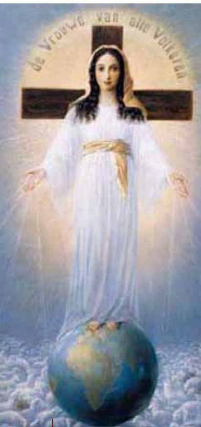
Veel van de boodschappen van Amsterdam zijn uitgekomen!