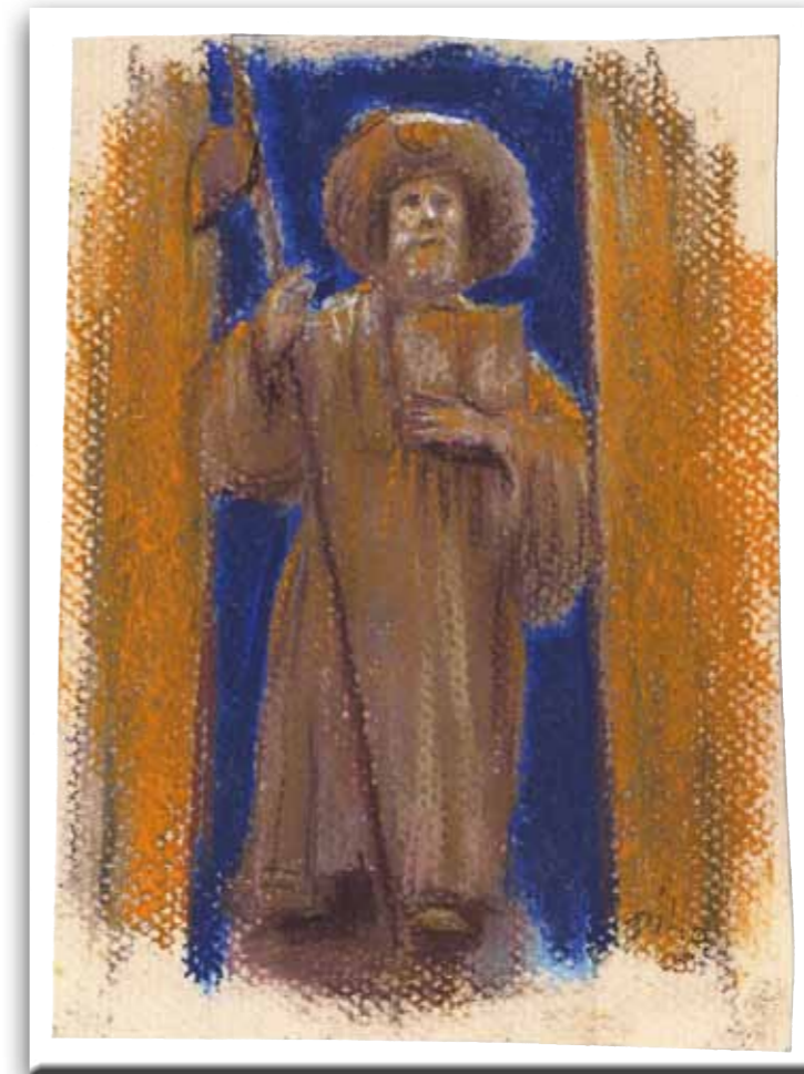
Sint Jacobus als pelgrim met staf, drinkfles, boek en hoed met schelp door Mieke Dillo.

De eerste beschrijving van zijn activiteiten dateert uit de vijfde eeuw. Er wordt verteld hoe hij in Judea preekte en daarna zonder succes in Spanje. Na zijn terugkomst wordt hij op aandringen van hogepriester Abjathar uitgeleverd aan koning Herodes Agrippa. Na zijn dood ontvreemden twee leerlingen het lijk, dat zij in een boot zonder roer leggen, waarna engelen het naar de noordkust van Spanje brengen. Een steen holt zichzelf uit om als sarcofaag voor Jacobus te dienen. Wilde stieren brengen het lijk in het kasteel van de heidense koningin Lupa, die zich daarom bekeert en Jacobus begraaft. Het graf wordt herontdekt in de negende eeuw. Een prach-