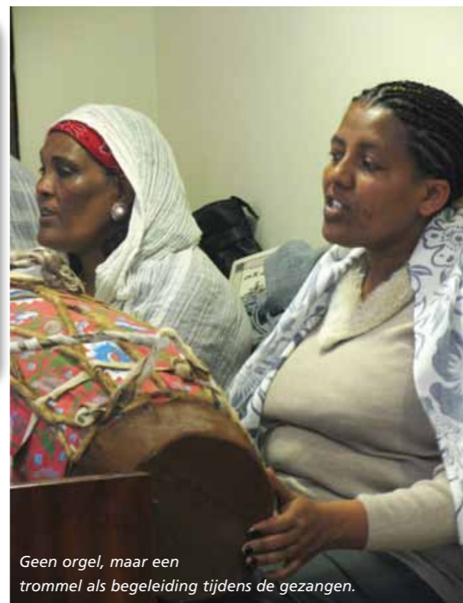
Geen orgel, maar een trommel als begeleiding tijdens de gezangen.