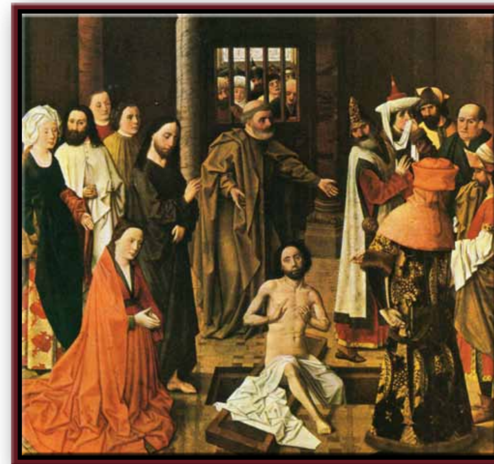
Albert van Ouwater (rond 1450): De opwekking van Lazarus. Let op de bescheiden plek van Jezus en de reacties van de gezagsdragers!

Mensen – hun dagen zijn als het gras, zij bloeien als bloemen in het open veld, dan waait de wind en zijn zij verdwenen en niemand weet waar ze hebben gestaan, zingt psalm 103. Maar dan komen de vragen. Niet als je lang en gelukkig geleefd hebt, dan ben je een mens van alle dag, zijn je dagen geteld, zegt ons de Bijbel. Wel als je jong sterft, van de honger in Afrika, als je met je fiets onder een auto komt of zomaar op straat wordt doodgeslagen. Of als je schoot amper is gesloten na het baren van kinderen en je de dodelijke kanker krijgt. Dan roepen wij waar is dat in godsnaam goed voor? Of meer berustend maar wel heel fout de Heer heeft gegeven, de Heer heeft genomen, de Naam van