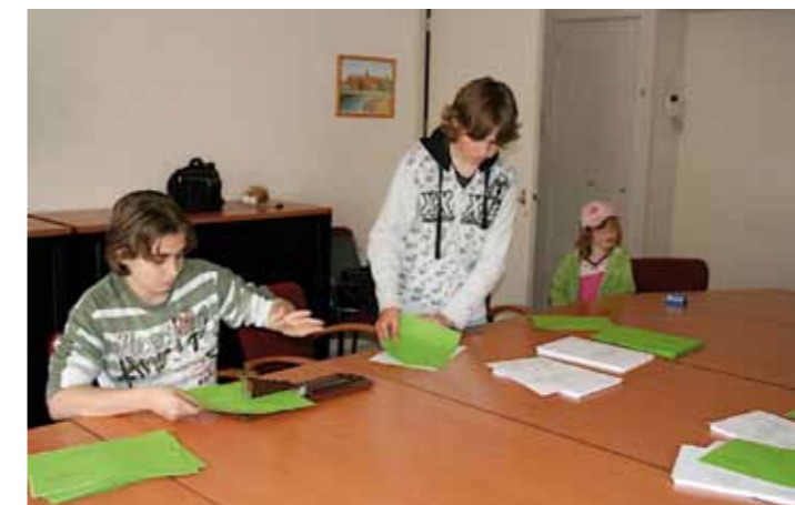
Maatschappelijke stage: misboekjes vouwen, koffie schenken en werken in de parochietuin.