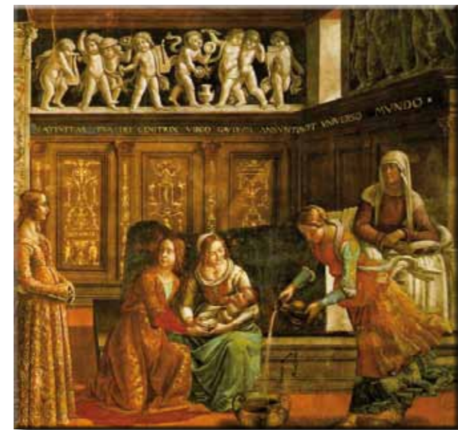
Domenico Ghirlandaio (1449-1494): Maria's geboorte. Fresco in de kerk van Santa Maria Novella in Florence (Italië).