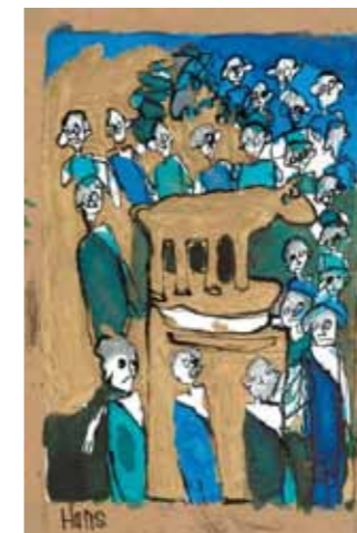
Afbeeldingen: 'de onthoofding van Johannes de Doper' door Piet Schopping en 'het gouden kalf' door Hans de Vries