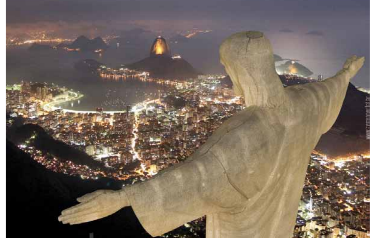
Het beroemde beeld van Christus de Verlosser in Rio de Janeiro, Brazilië.

Waarom is een boek als The secret zo populair en worden de boeken van Dan Brown zo goed gelezen en zijn de verfilmingen zo'n daverend succes? Het laat zien dat spiritualiteit aan belangstelling wint. Maar ook dat de mens zelf daarbij centraal staat. Hoe verhoudt zich dat tot de verlossing die wij met Pasen vieren?